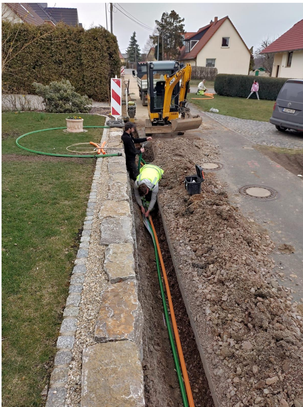
In der Schäferstraße in Klipphausen wird ein Hausanschluss an einen Haupthausanschlussverband angeschlossen.