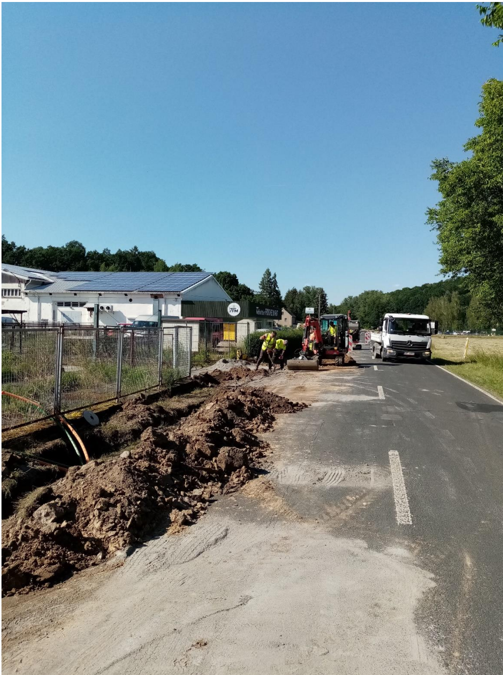
Am Triebischtaler Frischemarkt in Miltitz werden Breitbandleerrohverbände verlegt.