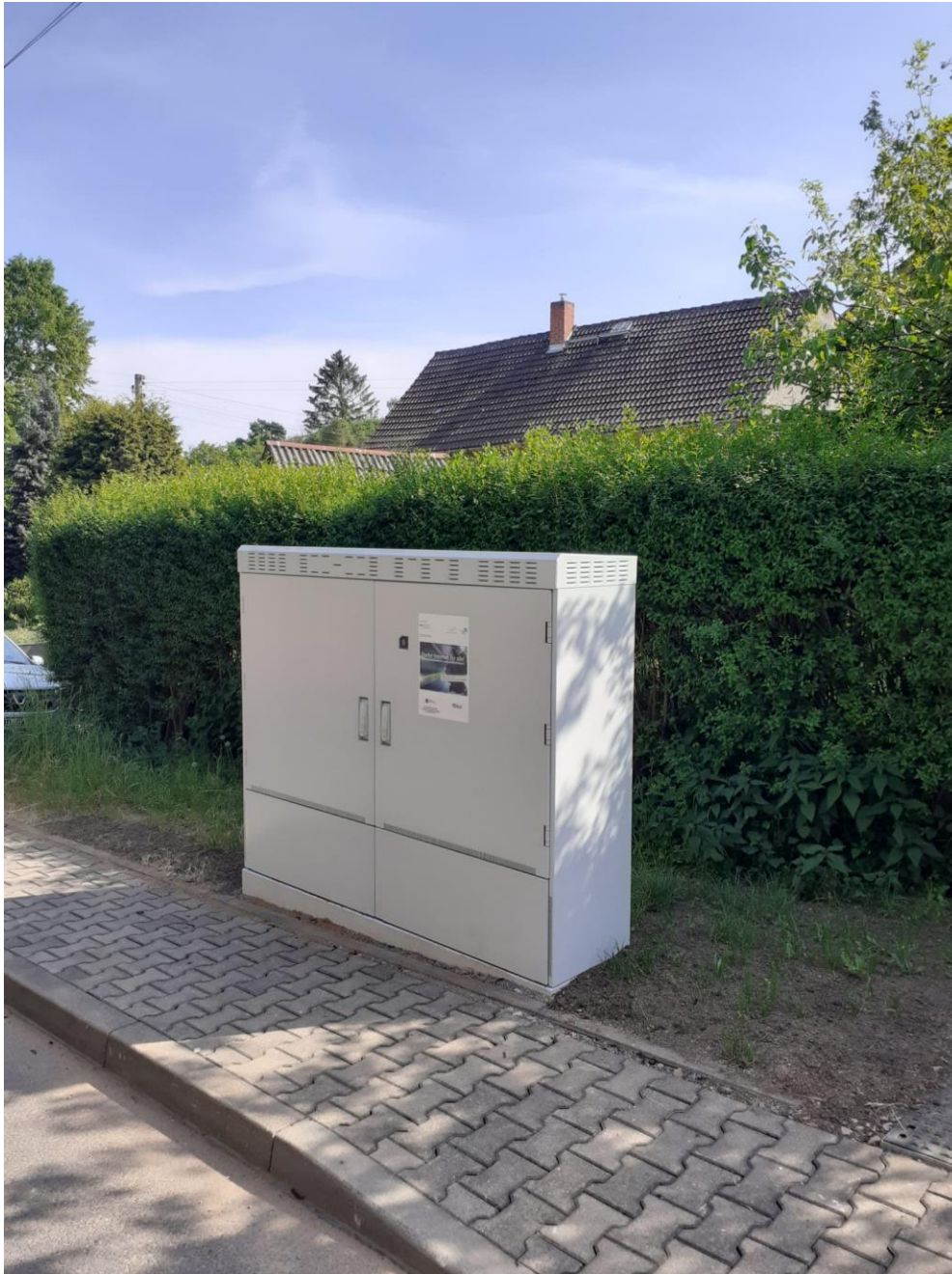
Der Letzte von insgesamt 20 oberirdischen Verteilern wurde in Miltitz aufgestellt.