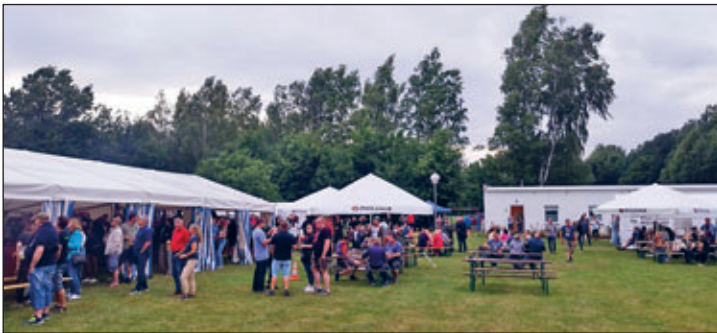
Das Festgelände im Jahnbad Miltitz