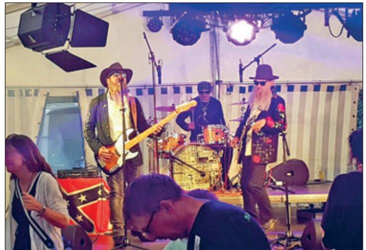
Die ZZ Top Revival Band bei ihrem Auftritt im Festzelt