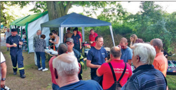
Verkaufsstand Freiwillige Feuerwehr

Die Zelte füllten sich rasch genau wie die Gläser mit Bier, Bowle und Wein. Kulinarisch wurde das Versorgungsprogramm mit Bratwürsten, Steaks, Fischbrötchen und Fettbommen ergänzt. Um 20 Uhr zündete die Freiwillige Feuerwehr Rothschönberg das Lagerfeuer, so dass vor romantischer Kulisse auch die Kleinsten unter uns einen Knüppelkuchen am offenen Feuer bruzeln konnten.