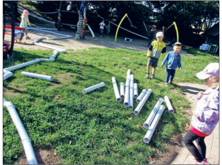
Die „kleinen“ Rohrverleger und ihre Erzieher der Kita „Regenbogen“