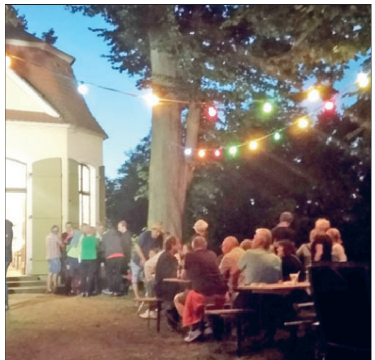
Pavillon im Lichterschein