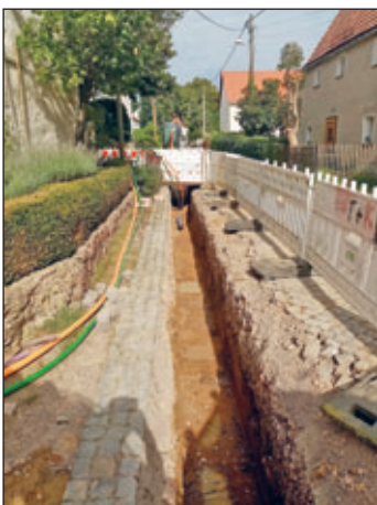
In Polenz wird neben dem Breitband auch die Trinkwasserleitung neu verlegt.

Der Netzbetreiber Vodafone informiert uns über den Beginn von Anschaltungen in den jeweiligen Ortsteilen.