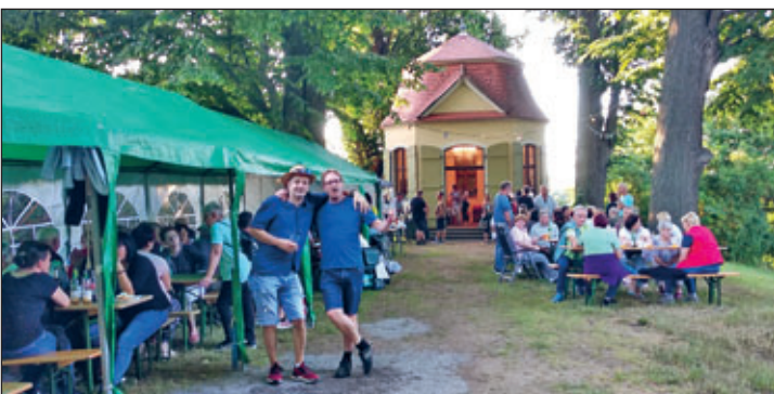
gute Stimmung unter den Gästen

Musikalische Umrahmung war gar nicht nötig, da sich alle angeregt unterhielten und Neuigkeiten austauschten. Bei zahlreichen auch auswärtigen Besuchern schaute man in strahlende und glückliche Gesichter, während bei lauschigen Temperaturen und guter Stimmung der Abend gegen Mitternacht langsam zu Ende ging. Leicht beschwingt traten unsere Gäste ihren Heimweg an und so freuen wir uns auf ein Wiedersehen im kommenden Jahr.