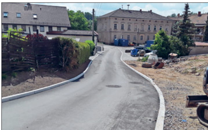
Zum Rittergutshof in Robschütz

Weitaus umfangreicher und nicht minder finanziell belastend waren die zentralen Erschließungen der entsprechenden Ortsteile. Hier war die Gemeinde Klipphausen in der Pflicht die Grundstücke über eine