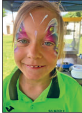
Das Kinderschminken fand großen Anklang (2)