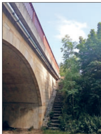
An der Brücke in Rothschönberg nach Groitzsch wurde eine Anhängung für die Versorgungsleitungen installiert.

Dies werden wir im Amtsblatt und auf unserer Homepage veröffentlichen.