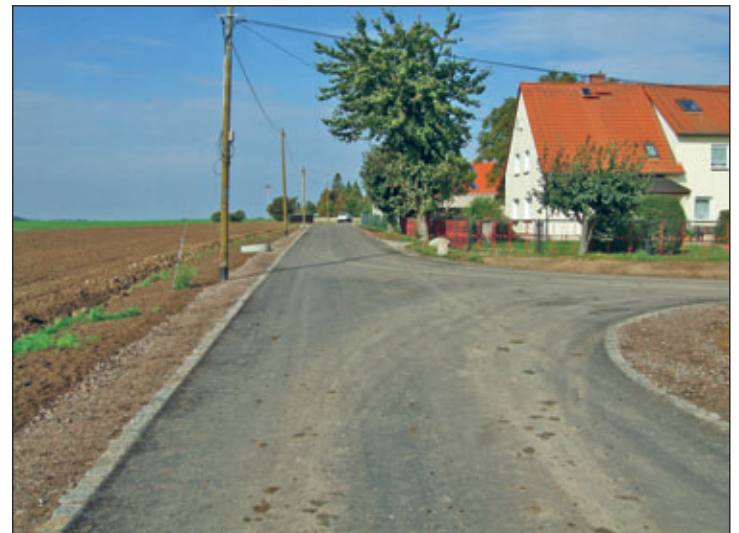
Am Sportplatz in Weistropp

In vielen Ortsteilen wurden dabei komplexe Baumaßnahmen entwickelt und durchgeführt um Mitverlegungssynergien zu nutzen, und um eine notwendige Infrastrukturverbesserung zu erzielen. So wurden unter anderem in Weistropp „Am Sportplatz“, in Obermunzig und zum Teil in Robschütz ein grundhafter Straßenausbau durchgeführt, wobei auch weitere Medien wie Breitband, öffentliche Beleuchtung, Trinkwasser und zum Teil Regenwasserkanäle mitverlegt oder erneuert wurden. In anderen Ortsteilen wie Garsebach, Wildberg „Am Berg“ oder Spittewitz wurde sich auf die Abwassererschließung beschränkt.