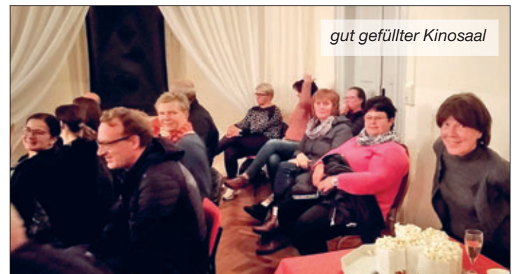
gut gefüllter Kinosaal