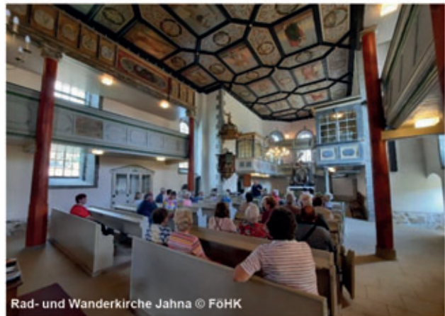
Rad- und Wanderkirche Jahna

In Ostrau gibt es am Jahnatalweg eine weitere Einkehrmöglichkeit, die Bauernstube. Der neu gestaltete Rastplatz Eschkemühle im Zentrum Ostras mit Wassertret- und Abenteuerspielplatz ist ein idealer Ort zum Verweilen und Sammeln eines weiteren Stempels der Entdeckertour ein. Dank einer Bürgerinitiative steht unweit das Kulturdenkmal Gasthof „Wilder Mann“ mit einem einzigartigen spätklassizistischen Ball- und Festsaal wieder für zahlreiche Veranstaltungen zur Verfügung.