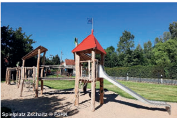
Spielplatz Zschaitz

2023 fusionierten Ostrau und Zschaitz zur Gemeinde Jahnatal. Der idyllische Jahnatalweg führt wie ein grünes Band durch die Gemeinde. Rund um den Burgberg in Zschaitz befindet sich direkt am Jahnatalweg mit dem Naherholungszentrum ein Rastplatz für Erholung, Sport und Spaß, u.a. mit Trimm-Dich-Pfad, Freiluftschach und neu gestaltetem Spielplatz. Im Sommer veranstaltet der Heimatverein hier Freiluftkinoabende. Vom slawischen Burgberg eröffnet sich ein wunderbarer Blick in die Umgebung. Natürlich steht am Naherholungszentrum auch einer unserer Stempelkästen von GERSTINs Entdeckertour. Der Gasthof in Zschaitz lädt mit familiärer Gastlichkeit zu einem Stopp ein. Weiter führt der Weg weiter nach Ostrau. Unterwegs lohnt sich ein kleiner Abstecher im Ortsteil Münchhof zum restaurierten Kalkofen mit Aussichtsplattform.