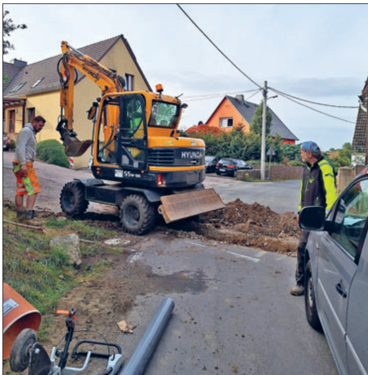
Die Arztpraxis von Torsten Schab in Burkhardswalde wird an das Glasfasernetz angeschlossen.

Mit Übergabe dieser Netzbereiche ist der physische Breitbandausbau durch die Gemeinde abgeschlossen. Nunmehr ist die Gemeinde beim Ausbau im Haus nicht mehr führend beteiligt und nicht mehr umfänglich zum zeitlichen Ablauf aussagekräftig. Der Betreiber Vodafone ist verantwortlich, diesen hausinternen Ausbau mit den Eigentümern zu koordinieren, Termine abzustimmen und den