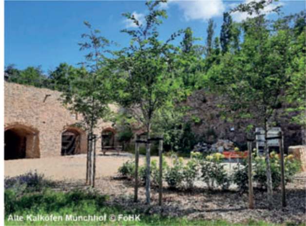
Alte Kalkofen Münchhof

In Ostrau gibt es am Jahnatalweg eine weitere Einkehrmöglichkeit, die Bauernstube. Der neu gestaltete Rastplatz Eschkemühle im Zentrum Ostras mit Wassertret- und Abenteuerspielplatz ist ein idealer Ort zum Verweilen und Sammeln eines weiteren Stempels der Entdeckertour ein. Dank einer Bürgerinitiative steht unweit das Kulturdenkmal Gasthof „Wilder Mann“ mit einem einzigartigen spätklassizistischen Ball- und Festsaal wieder für zahlreiche Veranstaltungen zur Verfügung.