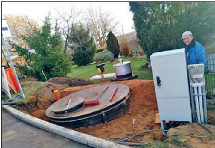
Herr Funke beim Einbau des Schaltschranks

Ende November wurde mit dem Einbau einer Druckerhöhungsanlage in Robschütz begonnen. Die Firma Nitsche Bauunternehmung GmbH aus Meißen hat hierfür die Baugrube ausgehoben und den Einbau des Schachtes sowie dessen anschließende Verfüllung durchgeführt. Die Mitarbeiter der Abteilung Trinkwasser der Gemeinde Klipphausen haben den technischen Anschluss an das Trinkwassernetz vorgenommen. Zudem wurden durch die Firma Funke Elektrotechnik aus Bockwen die elektrischen Anschlussarbeiten durchgeführt und ein Schaltschrank aufgebaut. Das Schachtbauwerk wurde von der Firma Hawle Kunststoff & Service GmbH aus Wiehl und die Druckerhöhungsanlage an sich von der PSD Pumpen-Service-Deutschland GmbH aus Bannewitz geliefert. Der Einbau der Druckerhöhungsanlage in den Kunststoffschacht erfolgte bereits im Werk der Firma Hawle, sodass vor Ort nur noch wenige Montagearbeiten durchgeführt werden mussten. Anfang 2024 muss dann nur noch der Anschluss an das Netz des Energieversorgers erfolgen, damit die Trinkwasserversorgung mit ausreichend Druck für die Grundstücke im Bereich des Schenbergs gesichert ist. Die Kosten der Maßnahme belaufen sich auf etwa 40.000 € und werden über den Haushalt der Gemeinde Klipphausen finanziert.