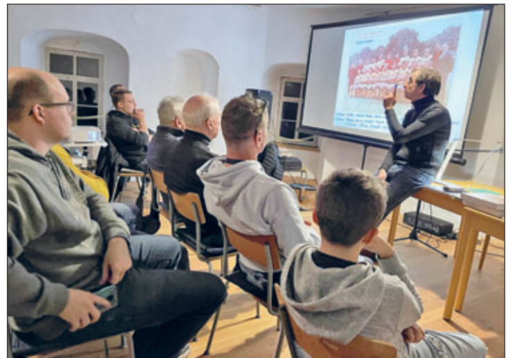
Gut 40 aufmerksame Zuhörer folgten den Ausführungen des Sportreporters.