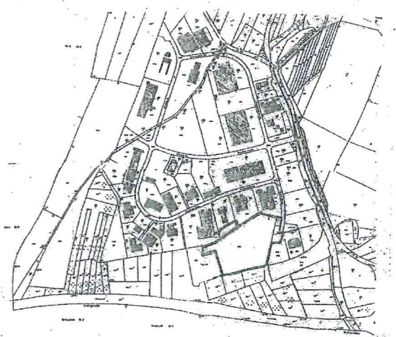
Übersichtsplan 1: 8000