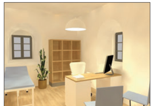
Blick in ein Behandlungszimmer

Hier werden unter anderem behindertengerechte Parkplätze, eine neue Zuwegung und auch eine kleine Terrasse als Pausenmöglichkeit für die Mitarbeiterinnen und Mitarbeiter entstehen. Durch die Maßnahme wird die Erreichbarkeit der Arztpraxis erheblich verbessert. Auch für das Team der Arztpraxis ergeben sich verbesserte Bedingungen für