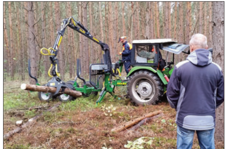
Holzrückung mit Traktor und Rückeanhänger im Privatwald

Anmeldung bis 06.09.2024 an info@fbg-grossenhain.de oder 0175/9379495