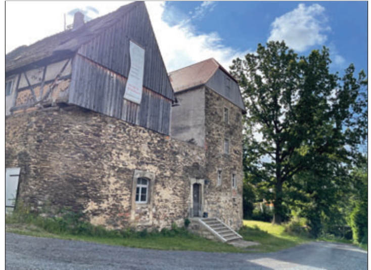
Der Spaziergang startet am Steingut Burkhardswalde.