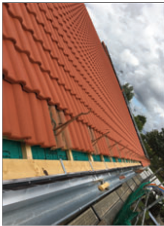
Dachinstandsetzung bei der Ausführung

Im Herbst 2023 wurde im Hortbereich der Grundschule Sachsdorf ein Wassereintritt durch auftretende Feuchtigkeitsschäden in der Decke festgestellt. Bei der Ursachensuche stellte sich heraus, dass gebrochene Dachziegel, verursacht durch fehlerhaft montierte Halterungen der Photovoltaikanlage, das Problem verursacht hatten. Durch die beschädigten Ziegel drang Wasser in die Dachkonstruktion ein. Umgehend wurde durch den Bauhof und den Hausmeister als Notmaßnahme eine Plane über die beschädigte Fläche gespannt, um eine weitere Schadensausbreitung zu verhindern.