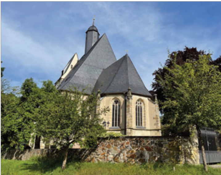
Es gibt Einblicke in die Dorfkirche des Ortes.

Der Sonntagsspaziergang unter dem Motto: „Festung, Wirtshaus, Dorfkirche - Auf Zeitreise ins Mittelalter“ wird gemeinsam organisiert vom Heimat- und Feuerwehrverein Burkhardswalde und dem Artur-Kühne-Verein Wilsdruff. Die Teilnahme ist kostenfrei. Parkplätze stehen im Ortskern von Burkhardswalde, aber auch in geringer Anzahl am Steingut zur Verfügung.