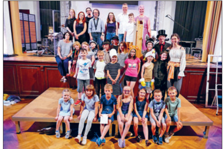
Großer Applaus für kleine Stars: Stolz auf ihre Leistung dürfen die 22 Kinder sein, die das Kindermusical im vollbesetzten Sachsenhof in Nossen aufgeführt haben.