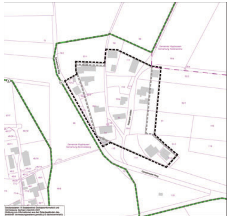
Übersichtslageplan (nicht maßstäblich):

(1) eine nach § 214 Abs. 1 Satz 1 Nr. 1 bis 3 BauGB beachtliche